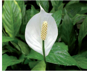
Le spathiphyllum contre un grand nombre de toxiques ( contenus dans les ciga- rettes, les peintures et les solvants )