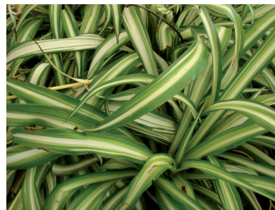
La chlorophytum contre le monoxyde de carbone, les solvants