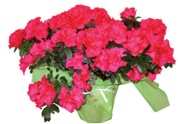
L'azalée contre l'ammoniaque