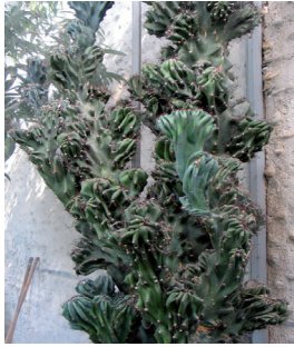
Le cactus cierge contre les ondes électromagnétique de l'ordinateur