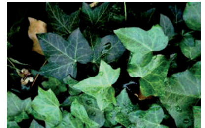
Le lierre contre le CO2, les solvants, les peintures