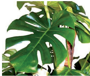
Le philodenron contre le CO2 (dioxyde de carbone)