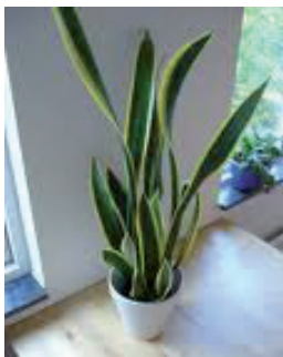
La sansevière contre les peintures, les colles, les dégrais- sants