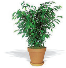
Le ficus contre le formol, les peintures