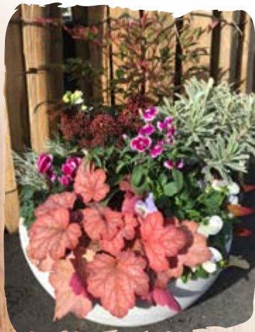
Contenant léger et tendance «Graphit»

Vous pouvez poser un géotextile au fond du pot pour retenir le terreau (afin qu'il ne bouche pas les trous)